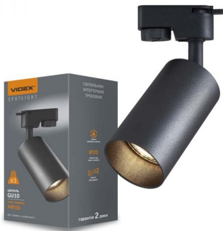
Трековий точковий світильник