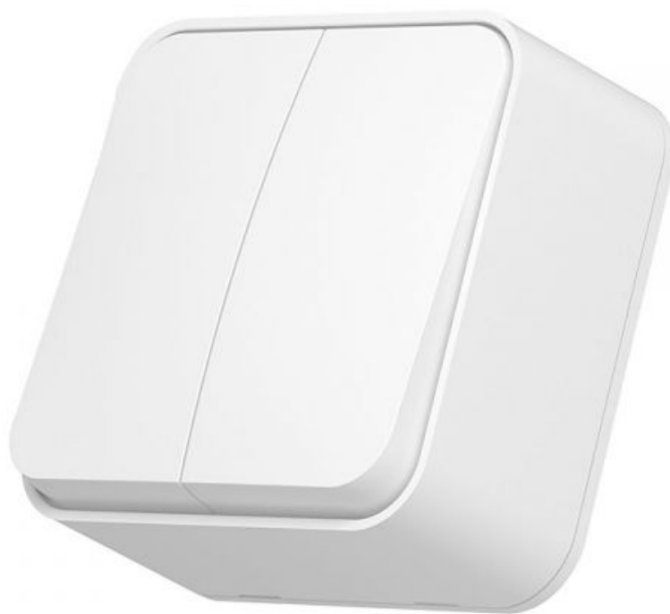
Вимикач накладний двоклавішний IP20 білий