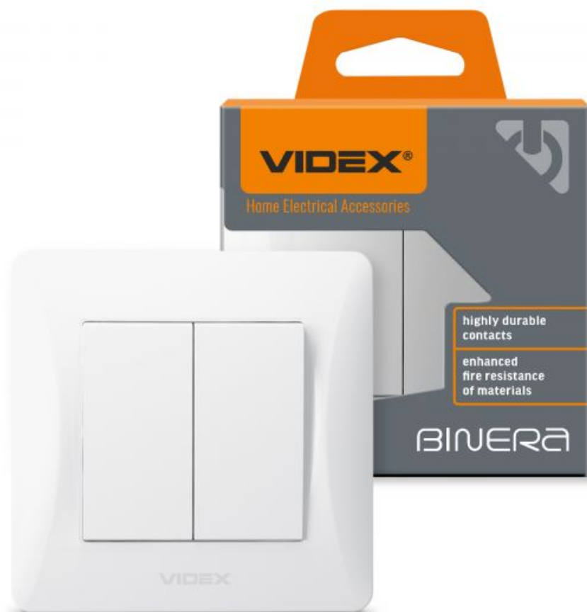
Вимикач двоклавішний білий