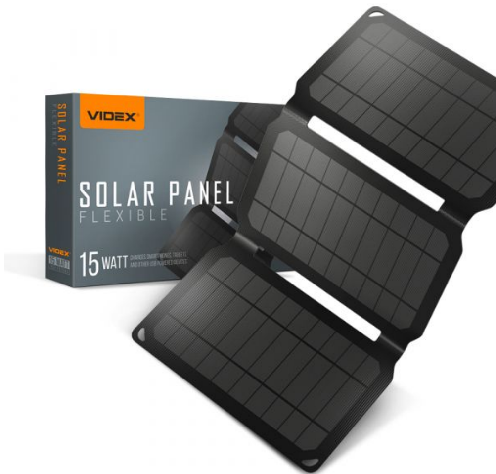
Портативний сонячний зарядний пристрій