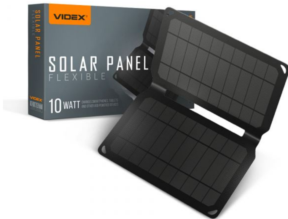
Портативний сонячний зарядний пристрій