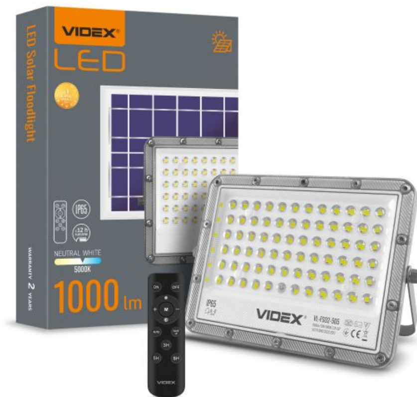
LED Прожектор автономний