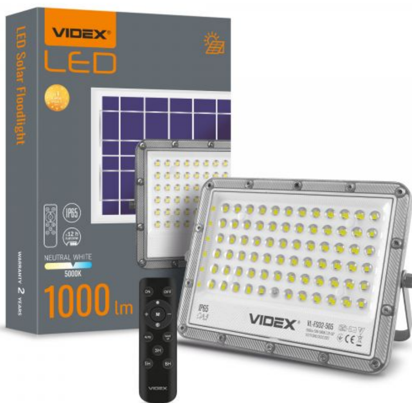
LED Прожектор автономний