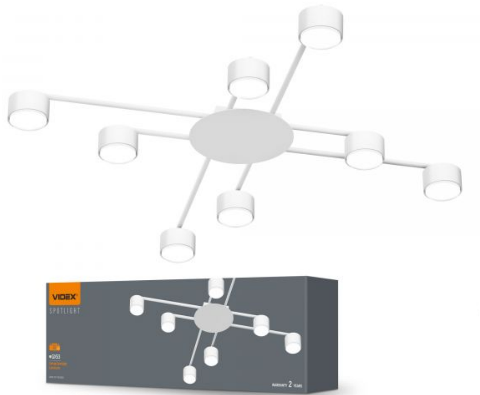
Стельовий точковий світильник