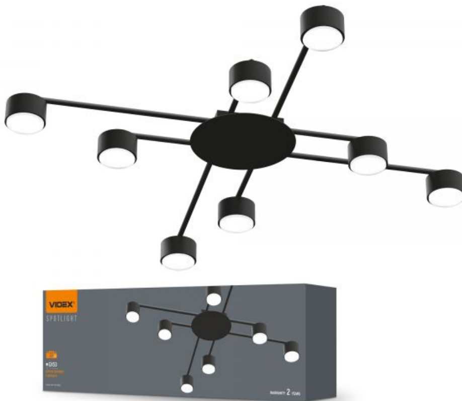
Стельовий точковий світильник