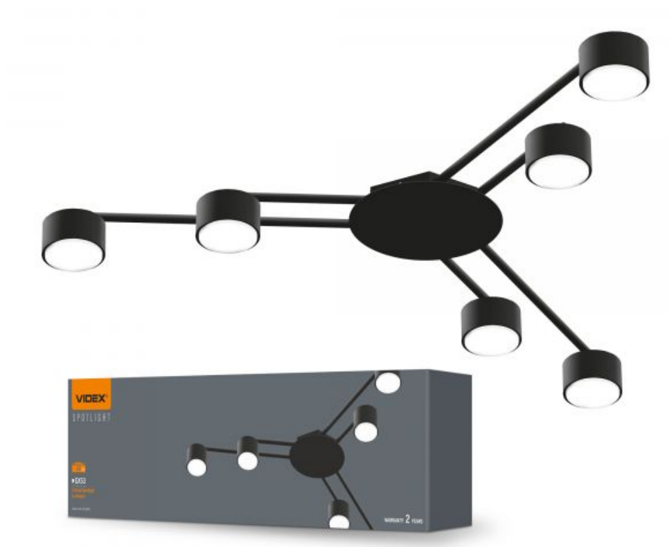
Стельовий точковий світильник