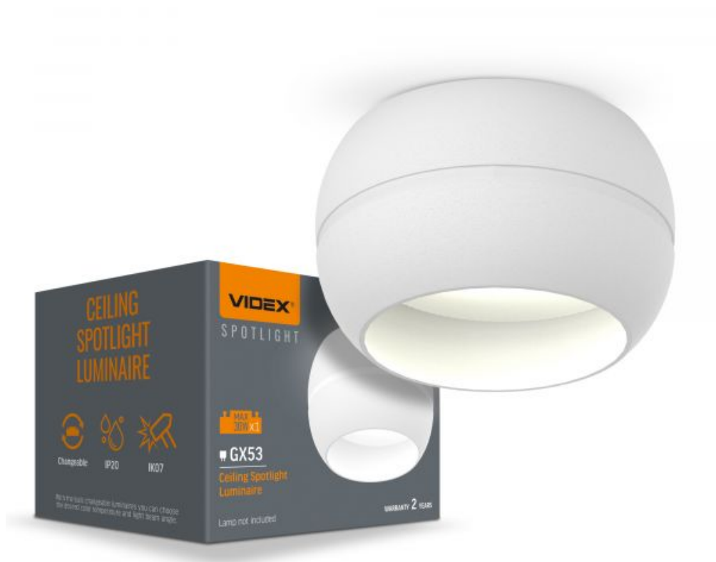
Стельовий точковий світильник