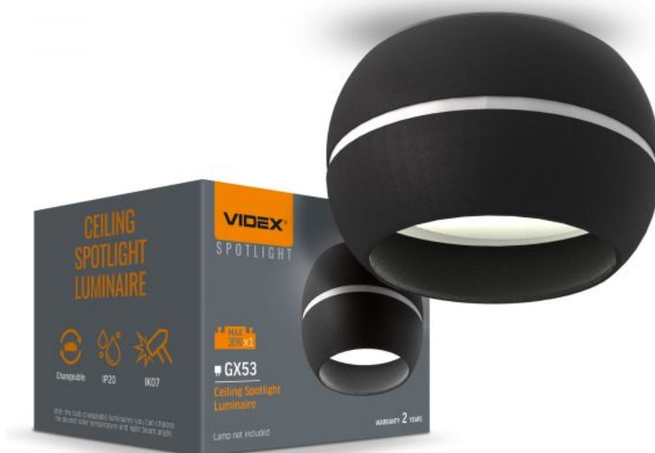
Стельовий точковий світильник