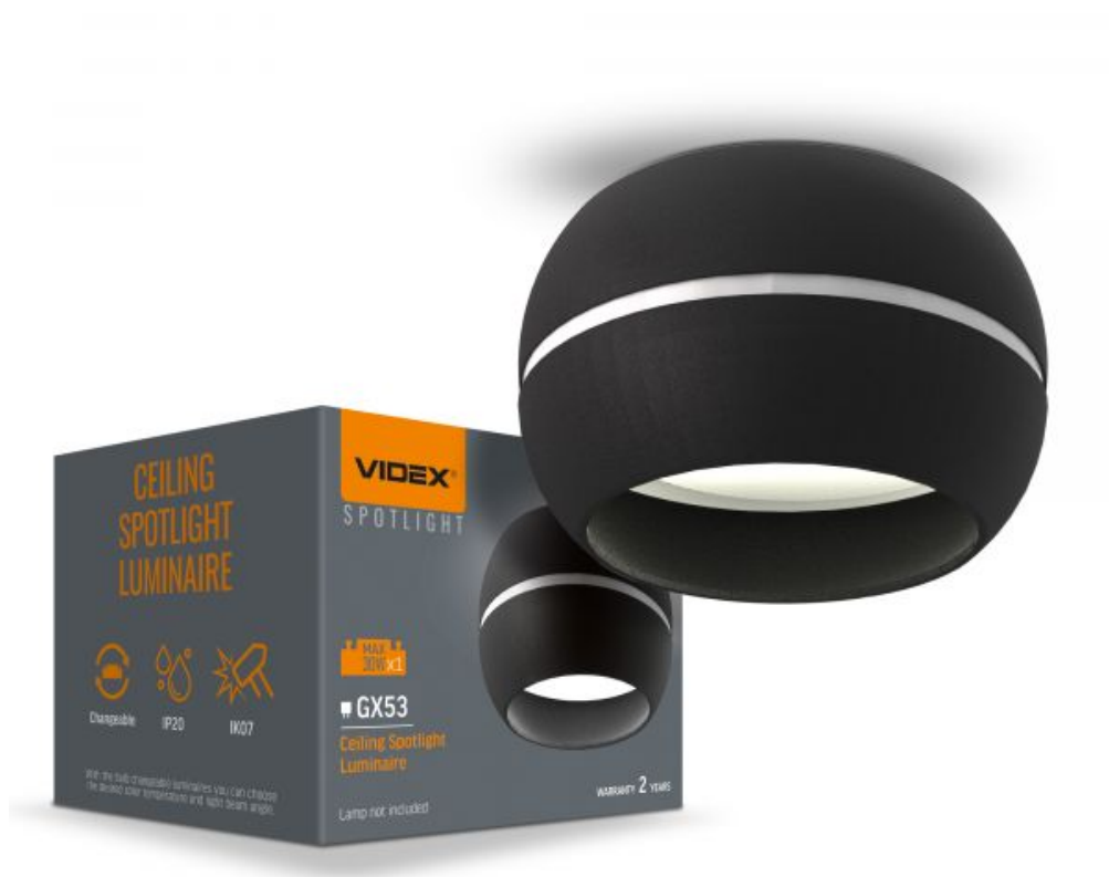
Стельовий точковий світильник