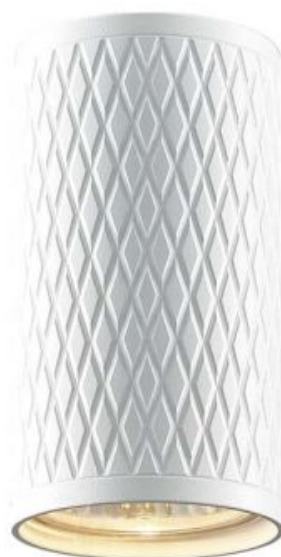
Стельовий точковий світильник