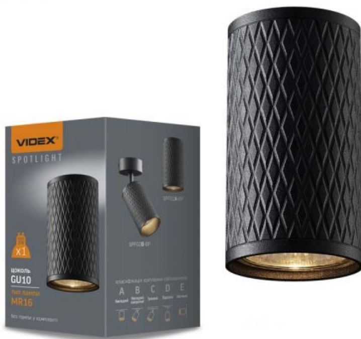
Стельовий точковий світильник