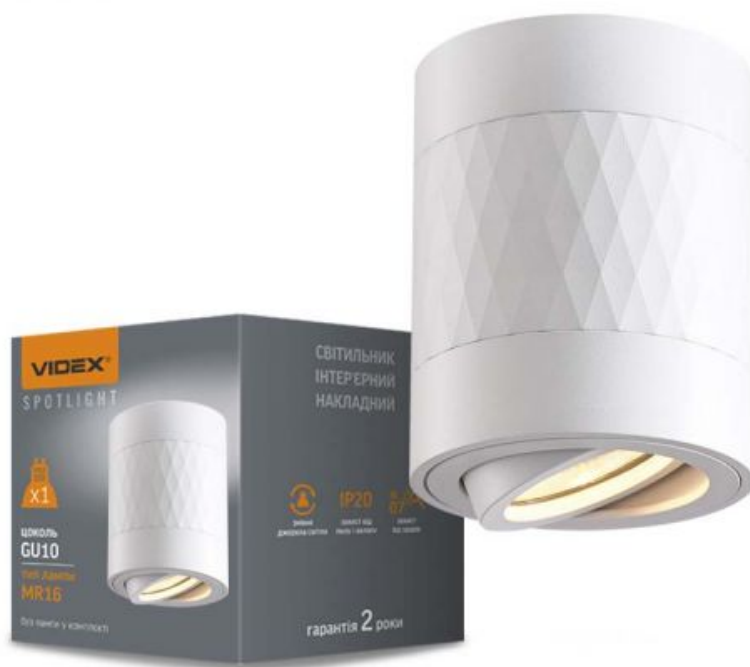
Стельовий точковий світильник