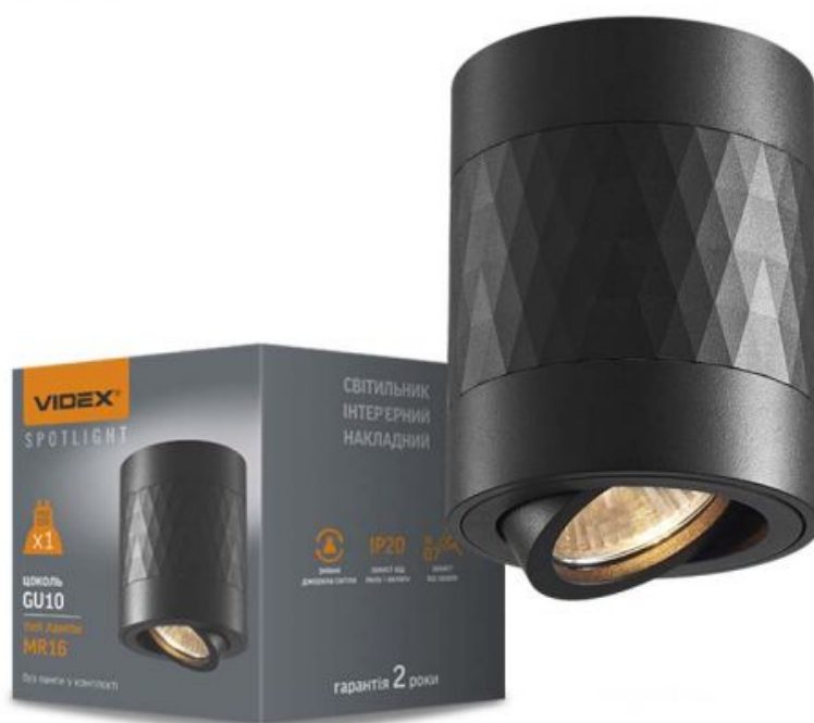
Стельовий точковий світильник