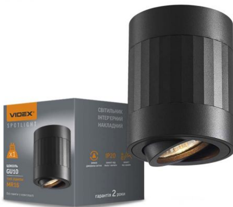
Стельовий точковий світильник