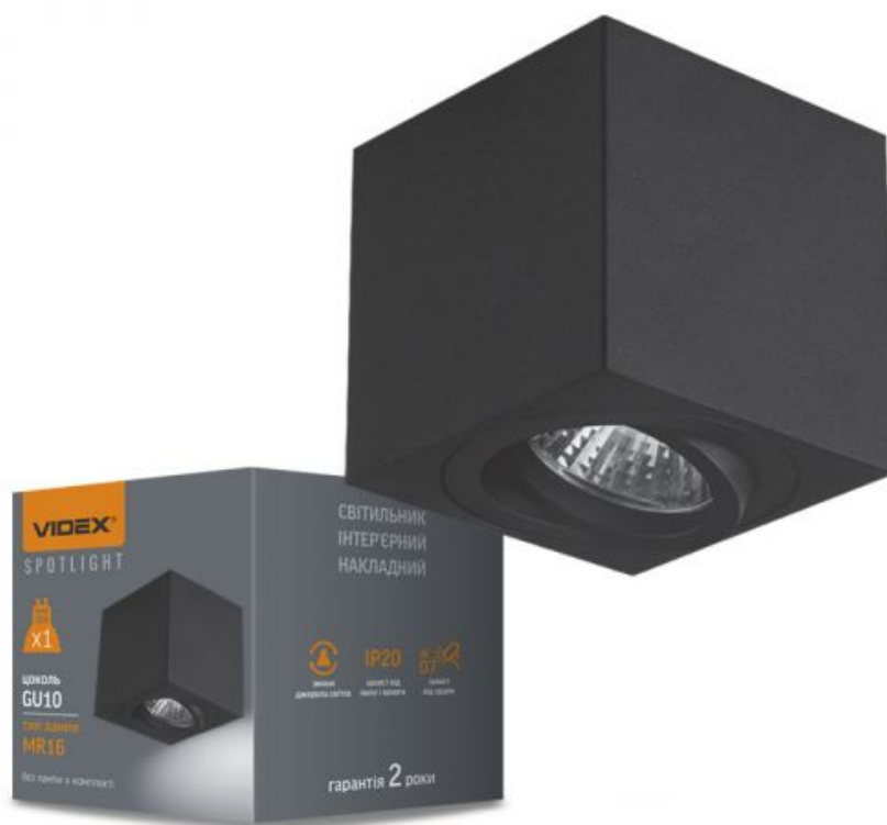
Стельовий точковий світильник