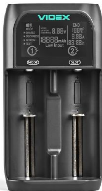
Ładowarka do akumulatorów