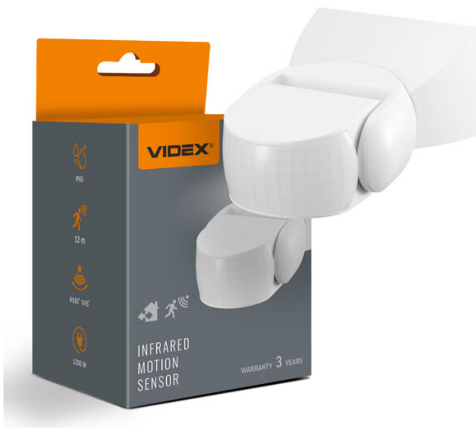
Czujnik ruchu i oświetlenia PIR