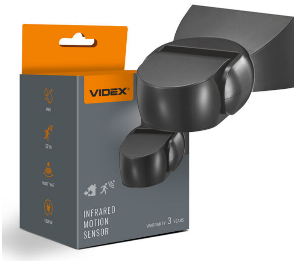
Czujnik ruchu i oświetlenia PIR