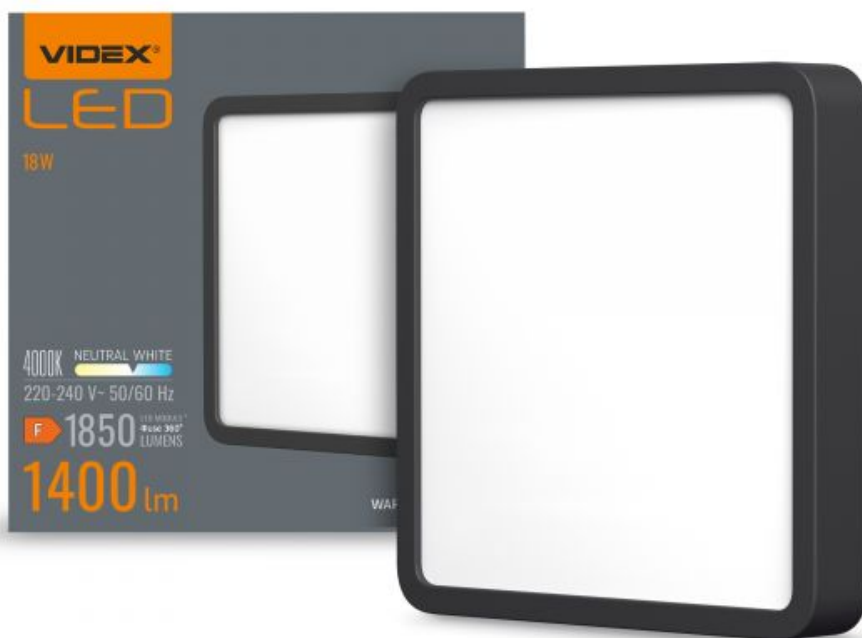
LED oprawa typu Downlight