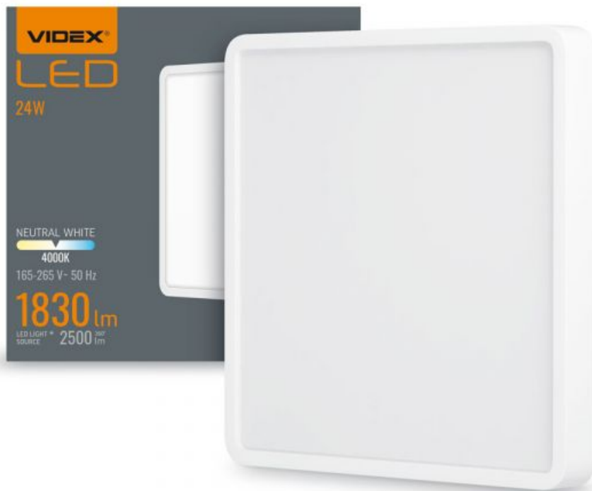
LED oprawa typu Downlight N/T