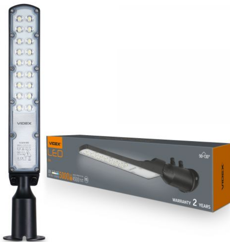
Lampa uliczna LED