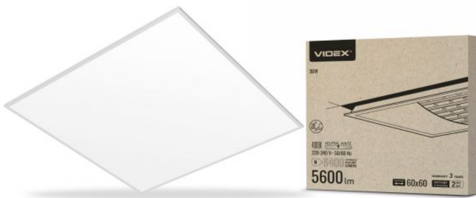
Panel LED do montażu wpuszczanego