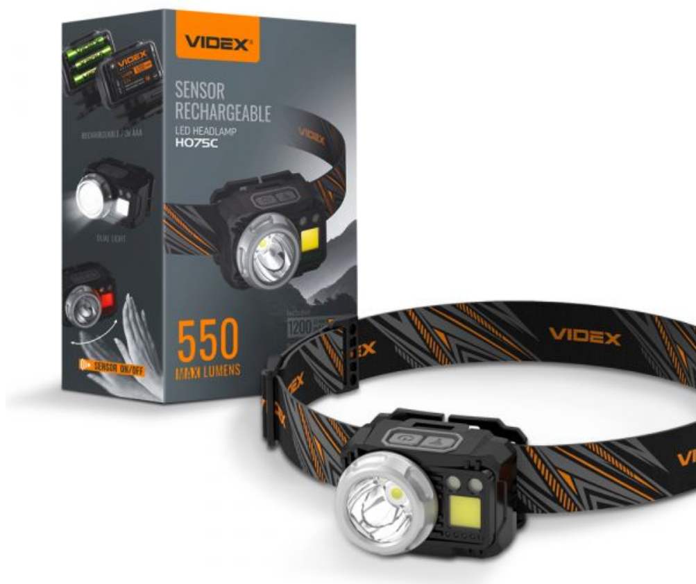
ŁADOWALNA CZOŁÓWKA LED