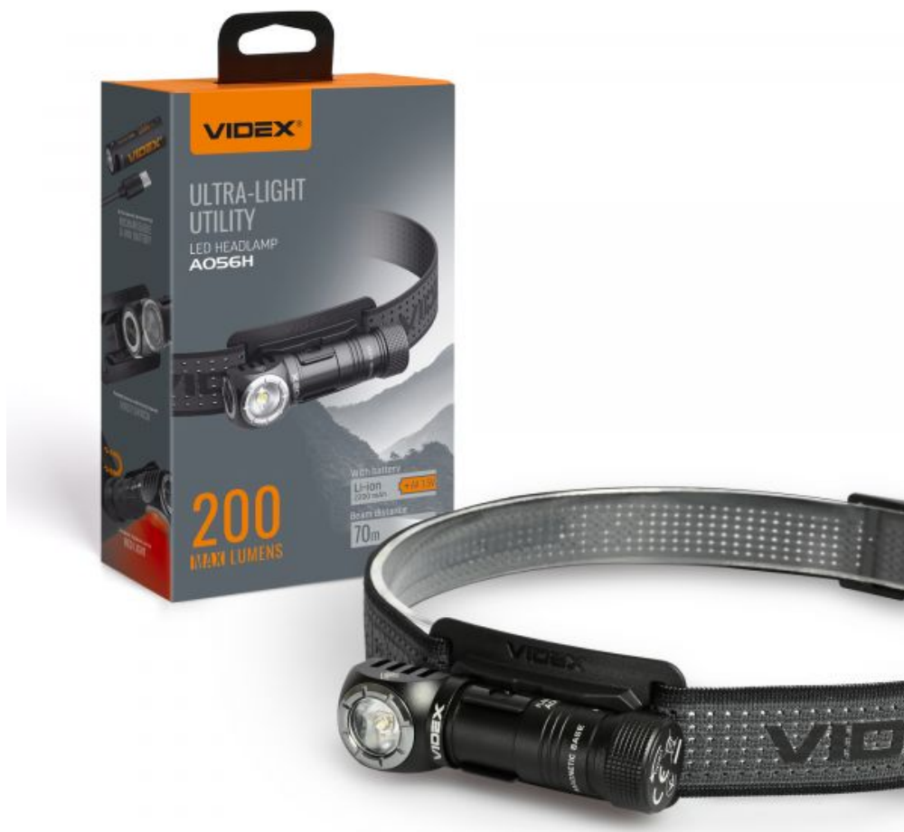
ŁADOWALNA CZOŁÓWKA LED