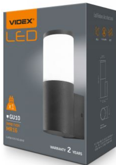
Oprawa Ledowa Architektoniczna