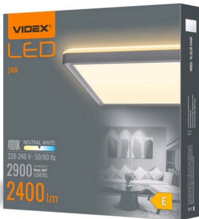
LED Oprawa sufitowa