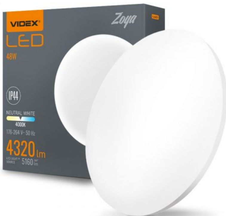
LED Oprawa sufitowa