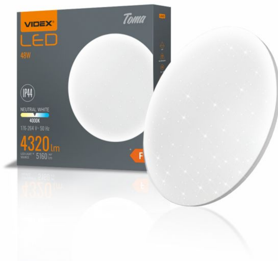
LED Oprawa sufitowa