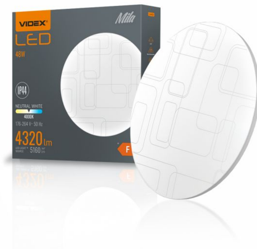
LED Oprawa sufitowa