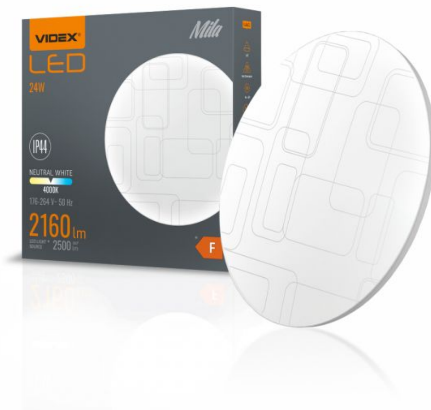
LED Oprawa sufitowa