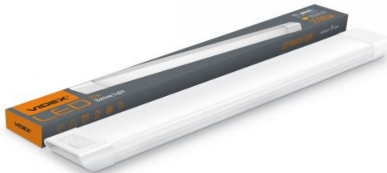
LED Listwa oświetleniowa