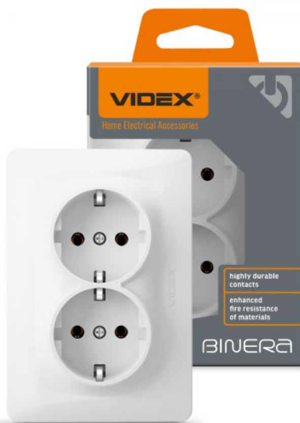
Gniazdo elektryczne podwójne shuko biały