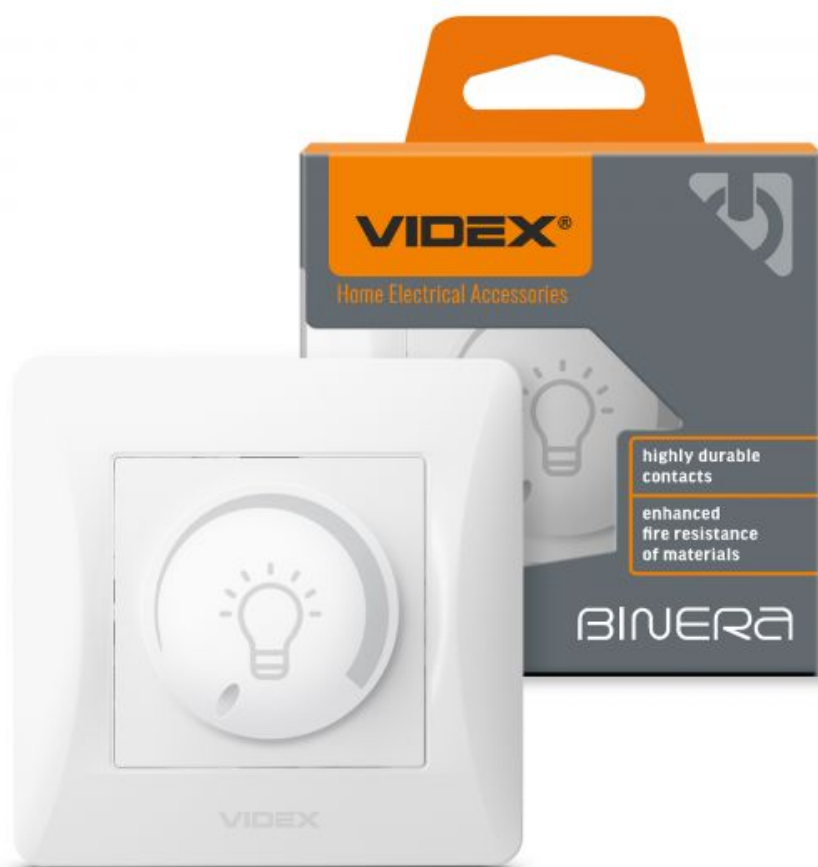
LED obrotowy 200W biały