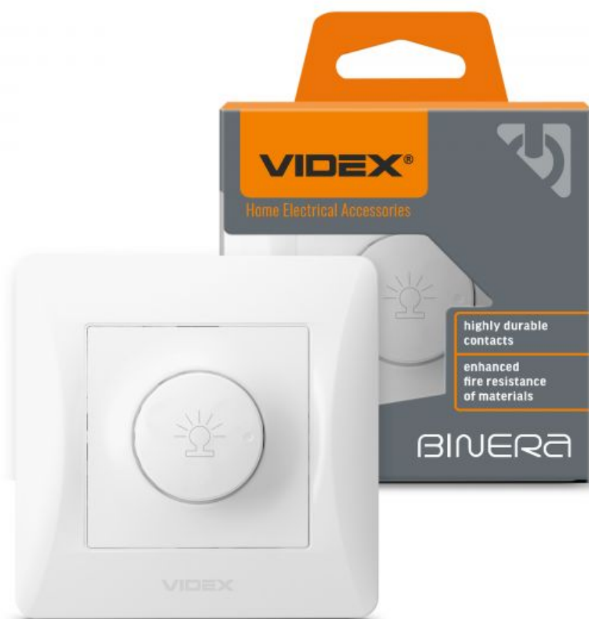
Dimmer obrotowy 15-600W biały