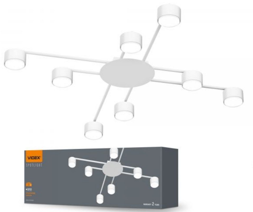
Oprawa sufitowa punktowa