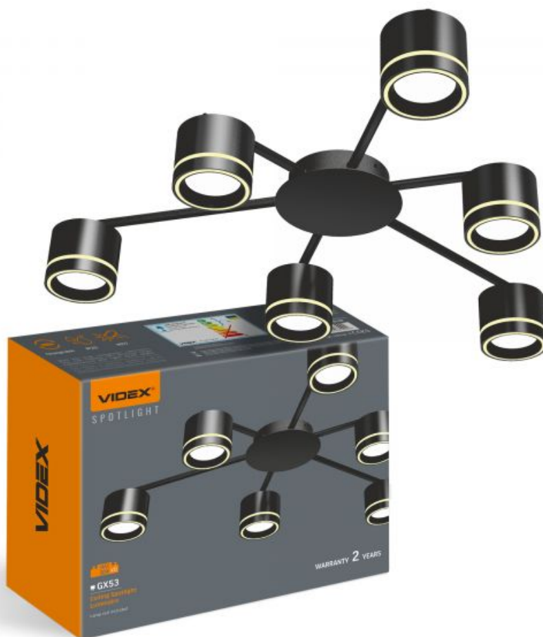
Oprawa sufitowa punktowa