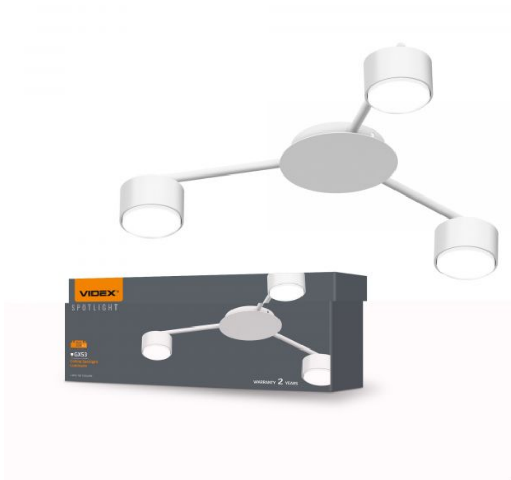
Oprawa sufitowa punktowa