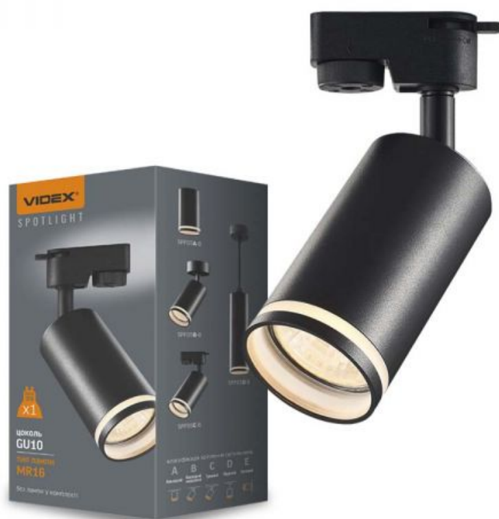
Oprawa szynowa punktowa