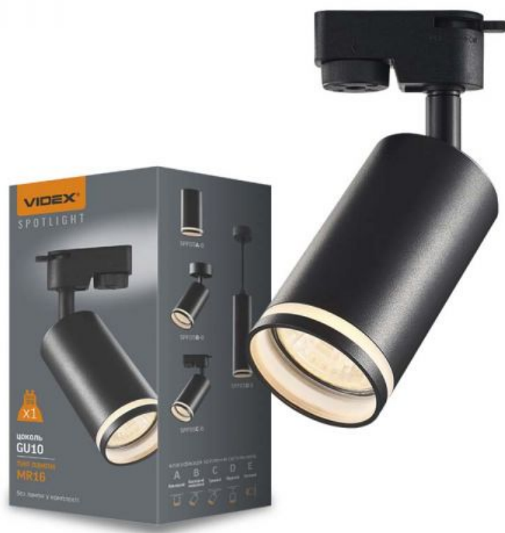
Oprawa szynowa punktowa