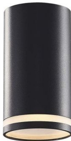
Oprawa sufitowa punktowa