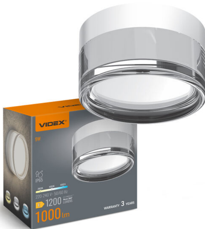
Wand- und Deckenleuchte LED