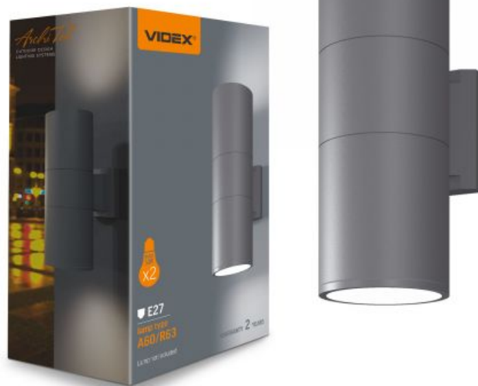
Fassade zweiseitige Leuchte