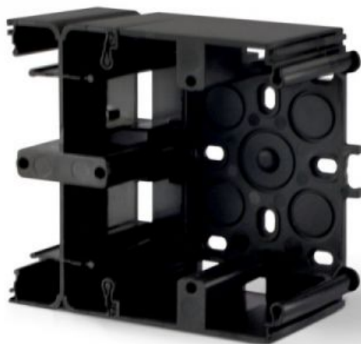
Aufputz-Modulgehäuse schwarz Graphit