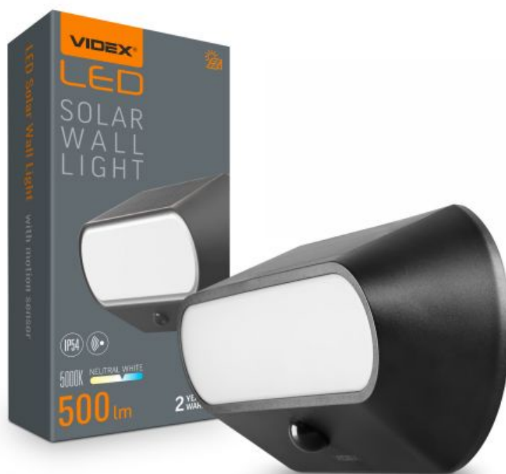
LED-SOLARWANDLEUCHE mit Bewegungssensor