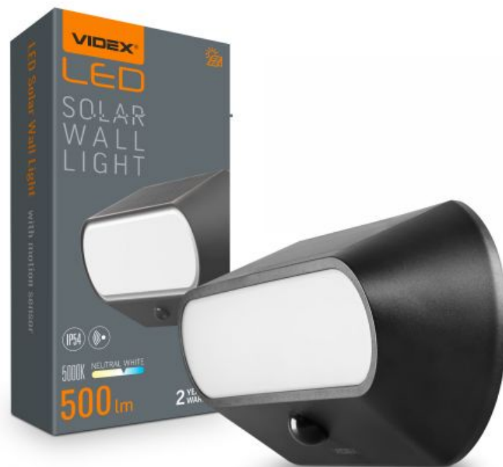
LED-SOLARWANDLEUCHE mit Bewegungssensor