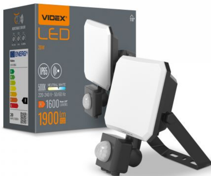
LED Flutlicht mit Bewegungssensor