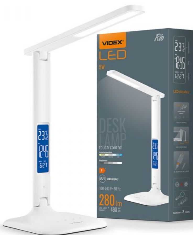
LED dimmbare Schreibtischlampe