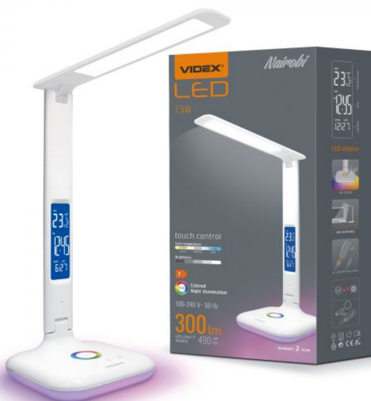
LED dimmbare Schreibtischlampe