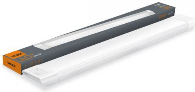
Linear LED Batten Leuchte